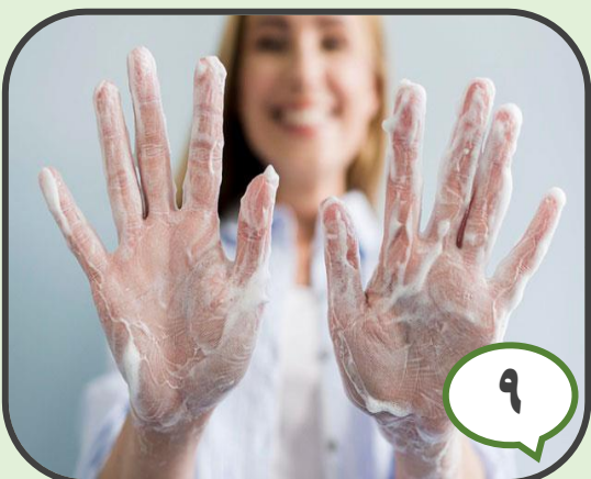
۹ بهبود بهداشت دست جهت جلوگیری از عفونت‌ها