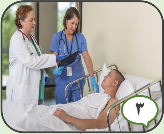
۳ برقراری ارتباط موثر کارکنان در زمان تحویل بیمار