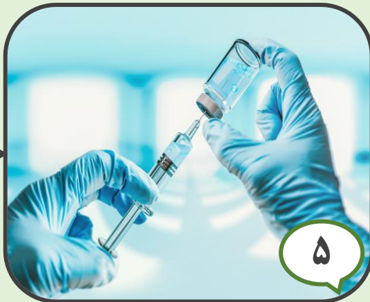
۵ کنترل محلول‌های الکترولیتی با غلظت بالا