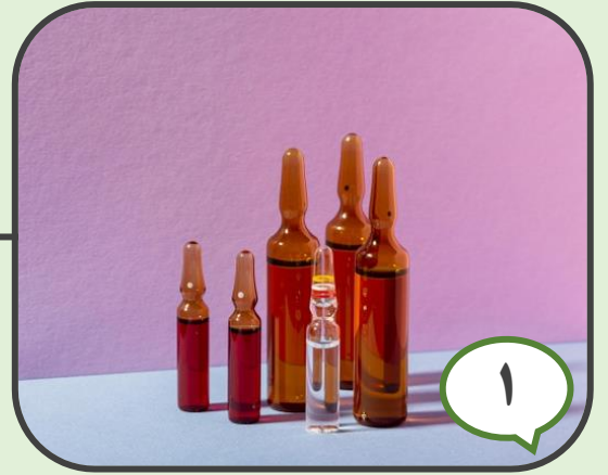
۱ توجه به داروهای با اشکال و تلفظ مشابه