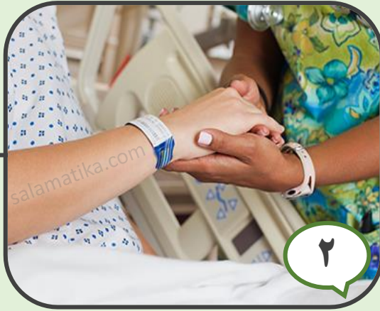
۲ شناسایی صحیح بیمار