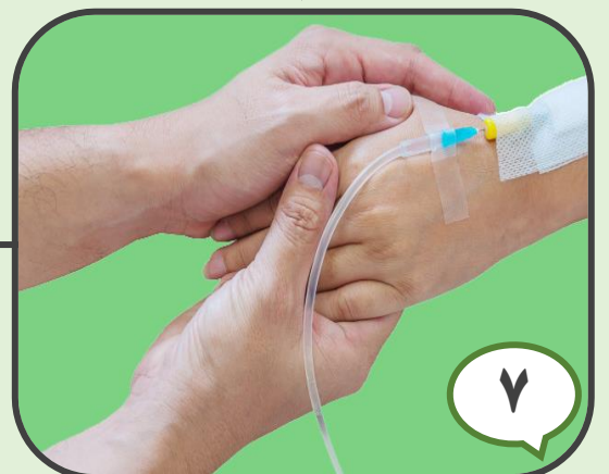
۷ اجتناب از اتصالات نادرست کاتترها و لوله‌ها