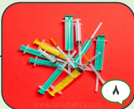
۸ استفاده‌ی یکباره از وسایل تزریقات